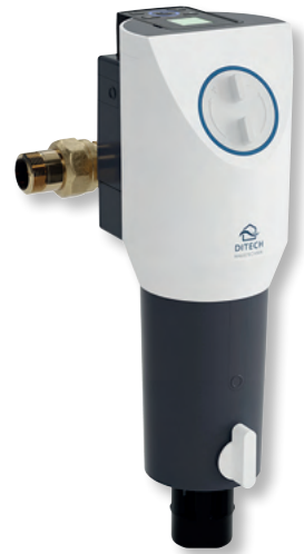
DITECH Rückspülfilter Protect Art.-Nr. DT3676