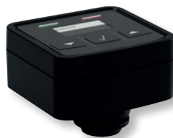
DITECH Digitale Kapazitätskontrolle Art.-Nr. DT3647 für Anschlussmodul Basic