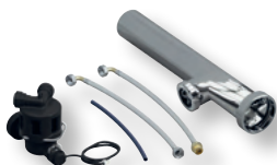
DITECH Anschluss-Set, Siphon Art.-Nr. DT3639