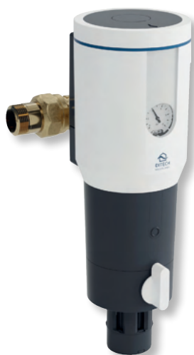
DITECH Rückspülfilter Art.-Nr. DT3651