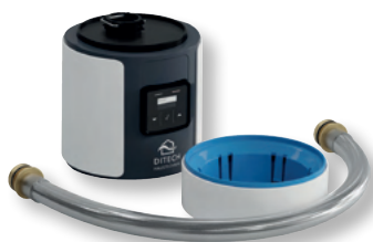
DITECH Anschlussmodul Basic Art.-Nr. DT3644

Der DITECH Anschlussblock DN 20 dient als Nachrüst-Schnittstelle für die DITECH-Anschlussmodule Basic und Plus.