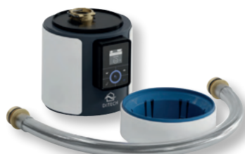
DITECH Anschlussmodul Plus Art.-Nr. DT3645

Das DITECH Anschlussmodul Basic DN 20 kann direkt über das Doppelschlauch-System an die DITECH FüllCombi BA angeschlossen werden.