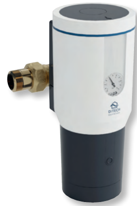
DITECH Wechselfilter Art.-Nr. DT3653