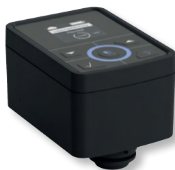
DITECH MultiControl Art.-Nr. DT3646 für Anschlussmodul Plus

Das DITECH Anschlussmodul Plus kann direkt über das Doppelschlauch-System an die DITECH FüllCombi BA angeschlossen werden,