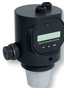
DITECH Mobile Füllstation Art.-Nr. DT7616

für die Befüllung mit vollentsalztem und ph-Wert stabilisiertem Wasser