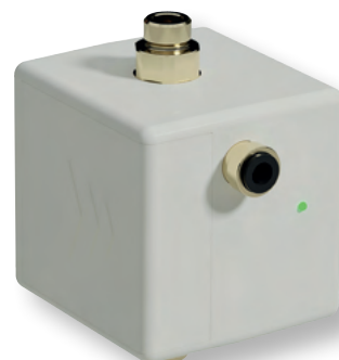
DITECH Hygienespülbox Art.-Nr. DT3638

Die DITECH Hygienespülbox mit integriertem WLAN ist die unkomplizierte und preiswerte Lösung für den bestimmungsgemäßen Betrieb der Trinkwasserinstallation. Die Armatur kann an Waschtischen und -plätzen, Küchenspülen sowie in gewerblichen und kleinen industriellen Anwendungen eingesetzt werden. Sie wird ohne großen Aufwand installiert, überwacht den Installationsbereich und löst dort bedarfsgerechte Spülungen auf Basis der eingestellten Stagnationszeit oder Wassertemperatur aus. Spülvolumen, Temperatur- und Druckmessungen werden protokolliert, sind via DITECH App jederzeit abrufbar und können im html-Format exportiert und auf einen USB-Stick gespeichert werden.