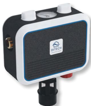
DITECH FüllCombi CA Art.-Nr. DT4158

Die DITECH FüllCombi BA dient dem automatischen Be- und Nachfüllen von Warmwasser-Zentralheizungsanlagen