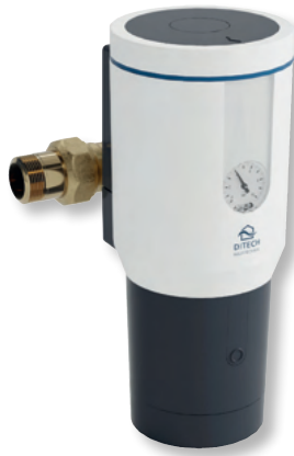
DITECH Wechselfilter mit Druckminderer Art.-Nr. DT3652