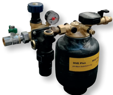
DITECH HVE Plus Kompaktstation Art.-Nr. DT7615

für die Befüllung mit vollentsalztem und ph-Wert stabilisiertem Wasser