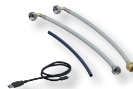
DITECH Anschluss-Set, 2 Boxen Art.-Nr. DT3641