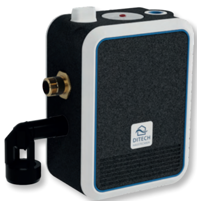
DITECH FüllCombi BA Art.-Nr. DT4157

Die DITECH FüllCombi BA dient dem automatischen Be- und Nachfüllen von Warmwasser-Zentralheizungsanlagen