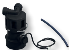
DITECH Anschluss-Set, Abwasser DN 40 Art.-Nr. DT3640