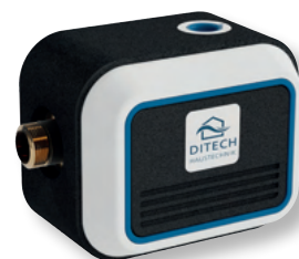
DITECH Anschlussblock Art.-Nr. DT3643

Die DITECH FüllCombi CA dient zur Automatisierung des Füllvorgangs von geschlossenen Systemen.