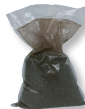
DITECH Kartusche Kombi zur Vollentsalzung mit pH-Wert-Stabilisierung DT760402 2,5 Liter DT760404 4 Liter DT760407 7 Liter DT760414 14 Liter

DITECH Austauschgranulat Kombi für pH-Wert-Stabilisierungs- kartusche DT76092 2,5 Liter DT76094 4 Liter DT76097 7 Liter