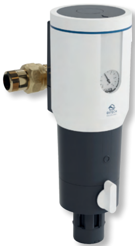
DITECH Hauswasserstation Art.-Nr. DT3650