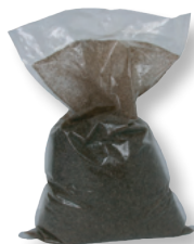
DITECH Kartusche zur Enthärtung DT760202, 2,5 Liter DT760204, 4 Liter DT760207, 7 Liter DT760214, 14 Liter

DITECH Austauschgranulat für Enthärtungskartusche DT76072, 2,5 Liter DT76074, 4 Liter DT76077, 7 Liter