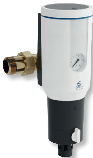
DITECH Hauswasserstation max Art.-Nr. DT3663